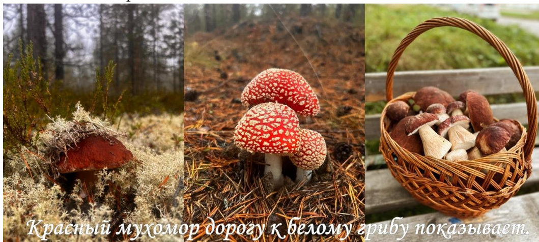
Красный мухомор дорогу к белому грибу показывает.

спешил» и «Оранжевое горлышко», рассказах К. Г. Паустовского «Заячьи лапы» и «Барсучий нос», а также рассказе С.Т. Аксакова «Осень». Внимание пользователей привлекли и экспонаты, относящиеся к литературным дебютам: стихотворение «Волшебный дуб», навеянное произведениями А.С. Пушкина, сказки «Мальчик и оленёнок» – о храбром маленьком пастухе, защитившем стадо оленей от волков и «Колян меняет мир» - о мудром муравье, который смастерил специальный прибор и с его помощью предотвратил экологическую катастрофу и многие другие замечательные творения.