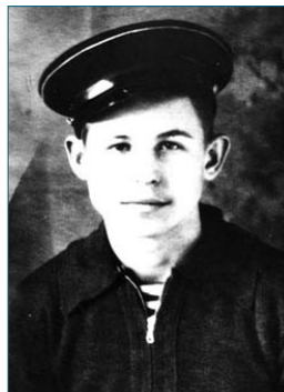
Николай Рубцов. 1953 г.